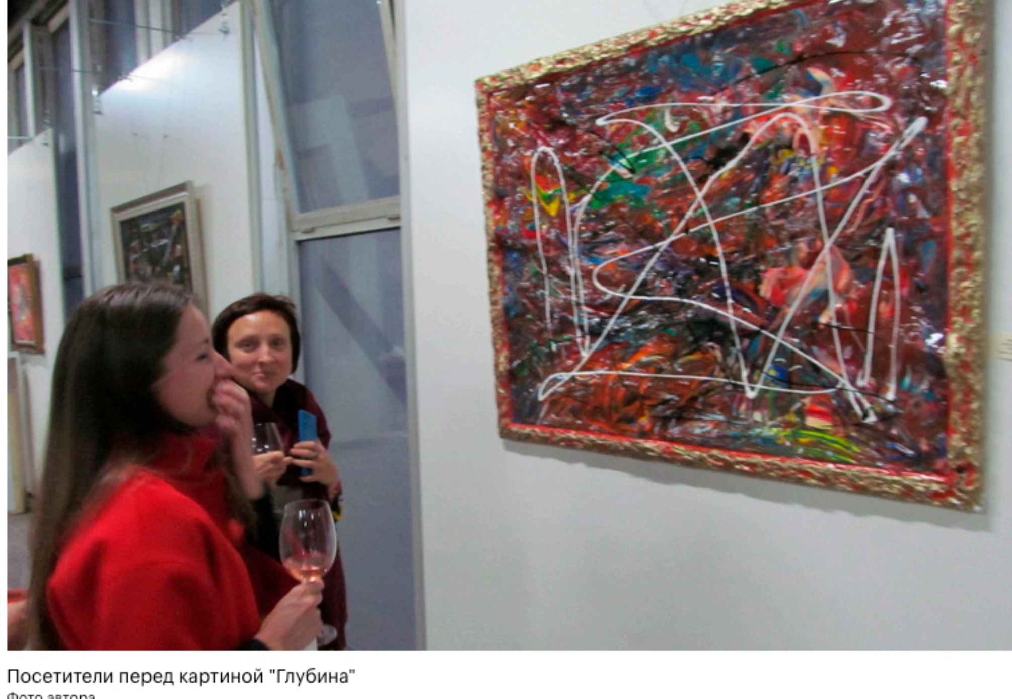
Посетители перед картиной "Глубина"