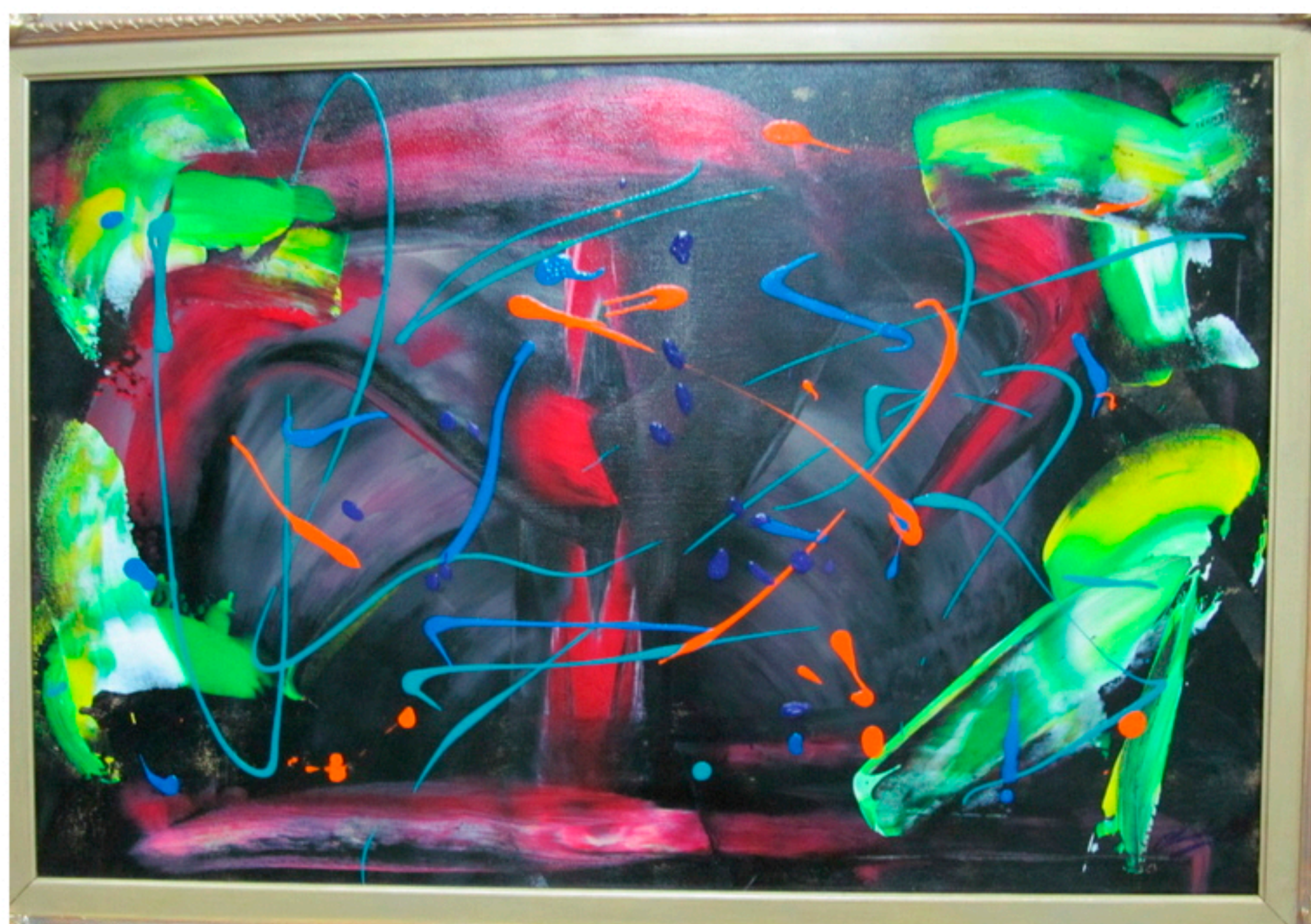
Картина «Хочу тебя» (2017)

«Сексуальность», «Хочу тебя», «Обнаженная».